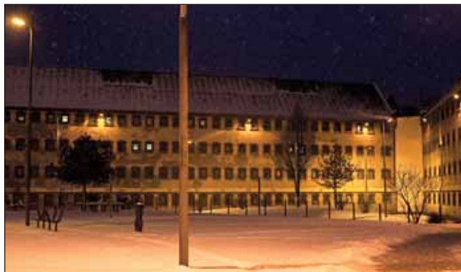
Bedrückende Atmosphäre: Innenhof der Justizvollzugsanstalt Bochum in einer kalten Winternacht