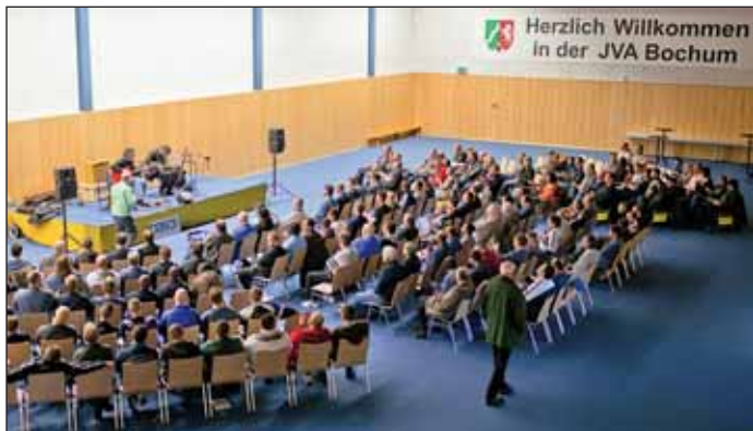
Von vermeintlich morbider Romantik à la Johnny Cashs „At Folsom Prison“ keine Spur: Das Konzert in der JVA Bochum hat einen nüchternen Rahmen