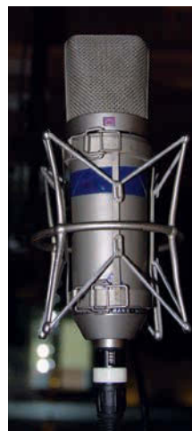
Eines DER Studiomikrofone überhaupt: Das Neumann U 87

komplett ausgebucht“, so Morcöl. Zudem schlägt man aus seinem Ruf zunehmend auch in anderer Form Kapital. „Es kommen extrem viel Touristen mit Rucksack und Fotoapparat, die unten klingeln, um das Studio mal