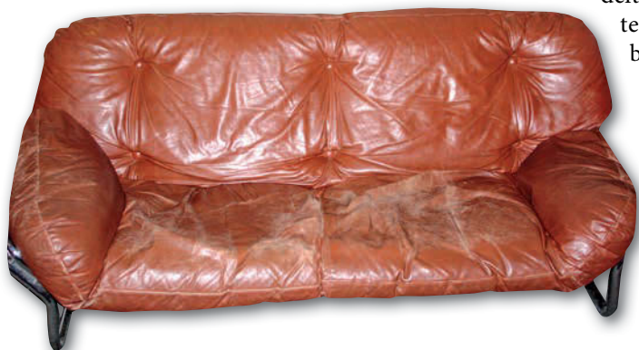
Spuren von Sex, Drugs & Rock, n' Roll? Das Sofa, auf dem sich Bowie & Co. fläzten, inspiriert die Fantasie des Betrachters