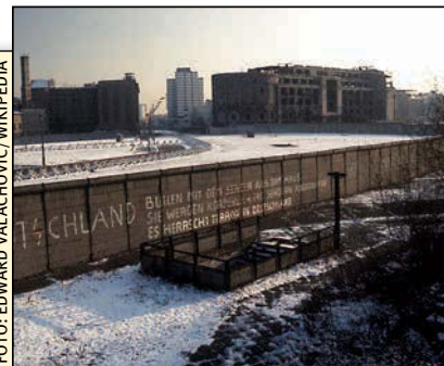
Der Potsdamer Platz 1975. Die Hansa Studios befinden sich rechts hinter der Ruine

duktions-Haus mit diversen Aufnahme- und Regieräumen. Der frühere Standort in der Nähe des Kurfürstendamms wird aufgegeben. Anfang der 1990er Jahre entscheiden sich die Meisels aufgrund des sinkenden Bedarfs zum Rückbau, so wird das Hansa Studio 2 wieder in seinen Urzustand als „Meistersaal“ zurückrestauriert. Heute firmiert nur noch das Studio 1 im vierten Stock als Hansa Studio. Gemeinsam mit den Emil Berliner Studios im Erdgeschoss (ehemals Hansa Studio 3) kann aber bei Bedarf der Meistersaal immer noch für Aufnahmen genutzt werden. Zudem beherbergt das Gebäude weitere eigenständige Studios und Produktionsfirmen.